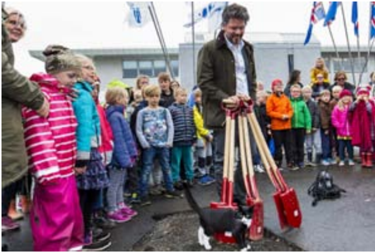
SKÓFLUSTUNGA Með viðbyggingunni er verið að mæta þörf vegna aukins nemendafjölda.