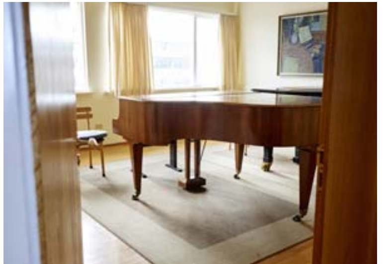
TÓNLISTARSKÓLINN Í REYKJAVÍK Fjórir tónlistarskólur í Reykjavík eru mjög illa staddir fjárhagslega.

Í tilkynningu frá mennta- og menningarmálaráðuneytinu segir að svo virðist sem Reykja-