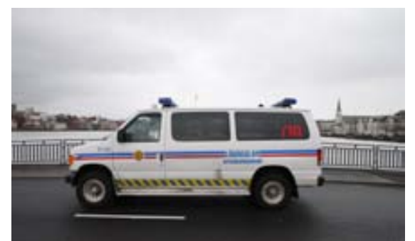
FERÐAÞJÓFAR Erlendir feðgar eru grunaðir um sex brot víðs vegar um landið.

Í framhaldinu virðast þeir hafa haldið áfram hringveginn í norður og austur. Er þeir grunaðir um þjófnað með svipuðum aðferðum,