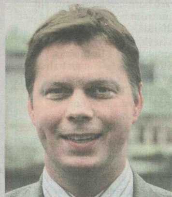
17,5 milljarðar Í svari borgarstjóra við fyrirspurn Kjartans segir að heildarkostnaðurinn við byggingu Hörpu og tengd mannvirki sé 17,5 milljarðar króna.

Honum finnst það rangt gagnvart skattgreiðendum að lægstu tölunni sé ávallt haldið fram. „Ég tók það sérstaklega fram þegar ég spurði að ég væri að spyrja um stóru töluna. Mér finnst eins og það sé verið að snúa út úr.“ ■